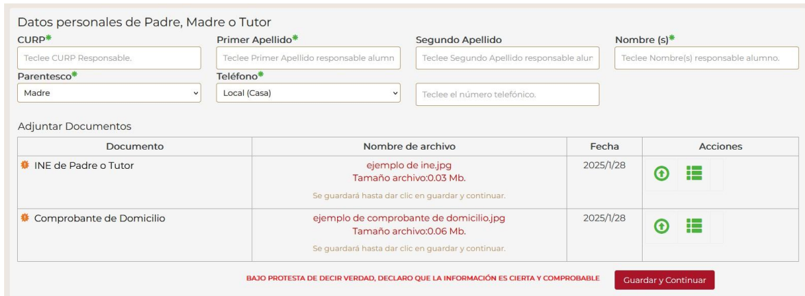
Imagen 10 Pantalla de Datos Personales de Padre o Tutor

4.- Se ingresa a la segunda sección Selección de Escuelas, donde se mostrará primeramente los datos del solicitante junto a folio generado que le corresponde y el código postal que se ingresó en la sección anterior, continuando se mostrara un listado de escuelas primeramente mostrando las escuelas cercanas al Código Postal ingresado en la sección anterior correspondiente y si no se cuentan con más de 2 opciones mostrara las siguientes escuelas relacionadas al Código Postal de la escuela de procedencia o del punto seleccionado para solicitantes sin historial académico en el estado.