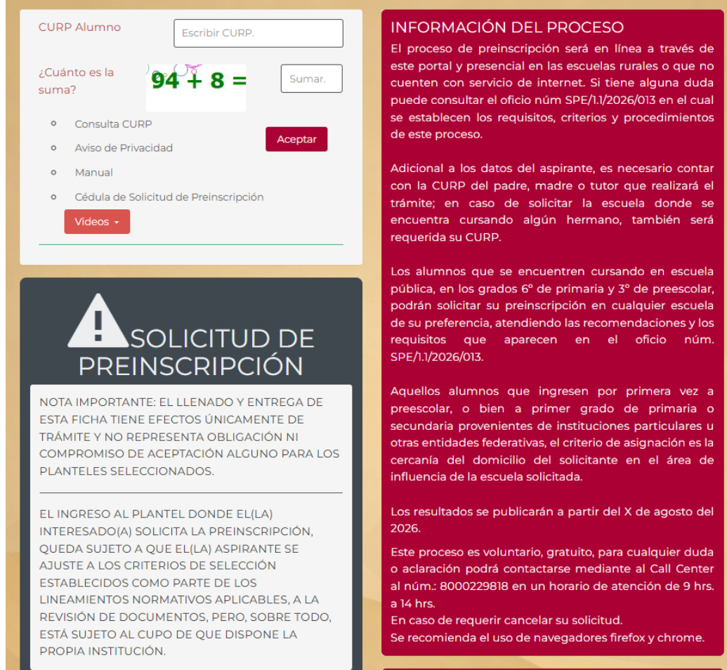
Imagen 01. Pantalla principal

2.- En la pantalla principal ingresaremos el Curp correspondiente al Aspirante, ingresaremos el dato correspondiente al reCAPTCHA y daremos clic en el botón Aceptar. De igual manera se cuentan con 3 link: