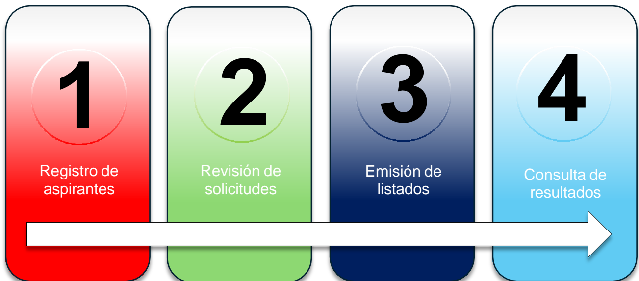
Figura 1. Proceso general de preinscripciones

La Secretaría de Educación Guerrero, a través de la Subsecretaría de Planeación Educativa y Subsecretaría de Educación Básica, ponen a su disposición las instrucciones para el manejo de la plataforma de las preinscripciones para llevar a cabo el proceso de registro de los aspirantes en las escuelas públicas de las 81 cabeceras municipales en el estado de Guerrero.